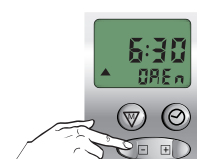
Stel de OP tijd in

GEEN OP tijd gewenst: kies dan de OFF tijd, deze komt na 23:59