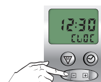
Stel huidige tijd in