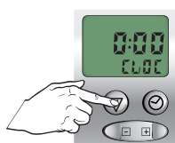
Vasthouden tot CLOC verschijnt