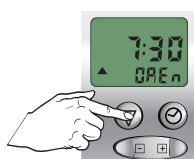
kort indrukken, OP tijd knippert