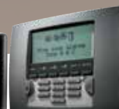
8 LCD-bedieningspaneel met badgelezer