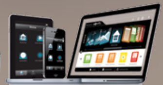
Te bedienen via internet